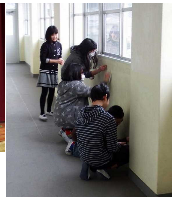
卒業生が学校の壁をきれいにしてくれました(3/15)