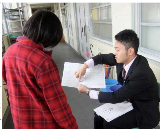
写真は、2学期終業式の日、「あしあと」を手渡している担任

「お子様が 生まれた時から のことを思い出してみてください。おもちゃをつかんだと喜び、立ったと喜び、歩いたと喜び、話せたことを喜んでいました。それが、いつの間に、他人と比べて、〇〇が できていない 。◇◇が不十分だということを感じるようになるのでしょうか。」これは、先日、ごせ幼稚園の卒園式に出席させていただいた折に、 園長先生の式辞 の中にあつた言葉です。私は、はっと思い、 共感 を覚えたので 引用 させていただきました。