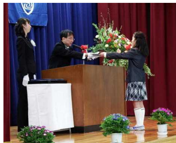
卒業証書授与(卒業式にて)

春休み中も、土日を除いて学校には職員がおりますので、何かありましたら学校までご連絡をお願いします。